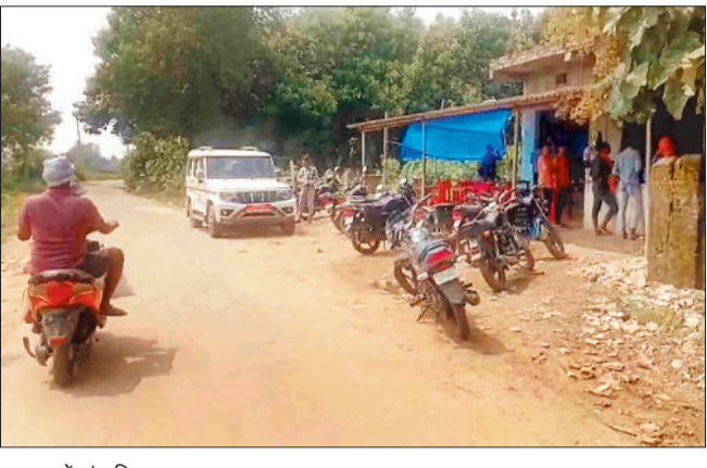
अहाता में संचालित शराब दुकान।