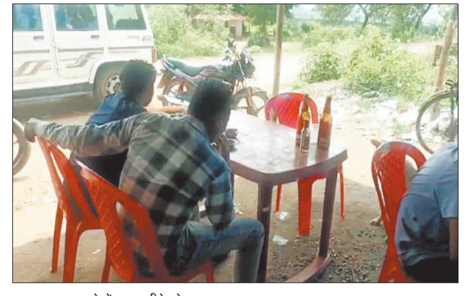
खुले में शराब पीते लोग।