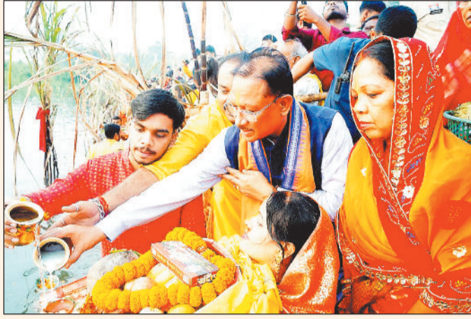
हरिभूमि न्यूज ►► जशपुरनगर