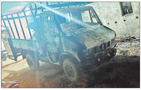
हरिभूमि न्यूज विश्रामपुर

ग्राम मदनपुर मंदिरपारा में रविवार की मध्यरात्रि उस समय हड़वार मच गया जब एक ही प रि वा र के दो वाहन में अज्ञा त कारणों से आ ग लगने से दोनों वाहनों के अलावा जनरेटर जलकर खाक हो चुका है। गौरतलब है कि जयनगर थाना क्षेत्र अंतर्गत ग्राम पंचायत मदनपुर मंदिरपारा निवासी प्रार्थी